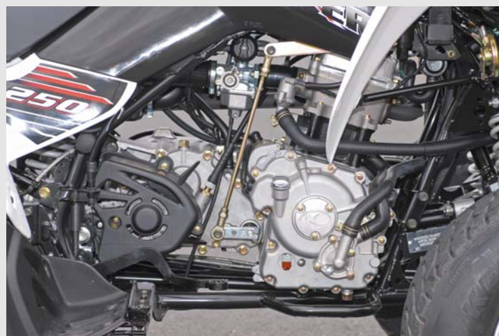
Alter Bekannter: Der wassergekühlte Einzylindermotor stammt aus der KXR 250

Ganz in weiß wartet die kleine Maxxer auf den Probegalopp. Die Bedienungsanleitung müssen wir uns dieses Mal nicht zu Gemüte führen: Lediglich die Betätigung der Parkbremse unterscheidet das Quad von dem 300er Modell.