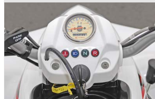
Einfach: Analoges Tacho und Kontrolleuchten