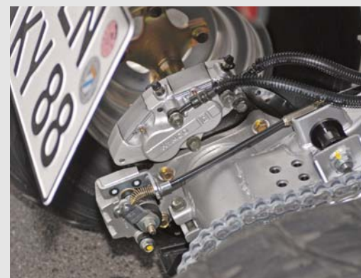
Vorschrift: Mechanische Zusatzbremszange

Laut Homologationspapieren leistet der 250er Kymco-Motor 16,9 PS und ist so marginal schwächer als das 300er Triebwerk. Der Hauptunterschied zwischen den Aggregaten findet man in der Kurbelwelle. Der Viertellitermotor muss mit 60 mm Hub auskommen, während der Kolben des „große“ Triebwerk 5,7 mm mehr Weg zwischen dem oberen und unteren Totpunkt zurücklegen muss. In