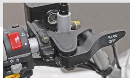
Praktisch: Klapphebel für die Parkbremse