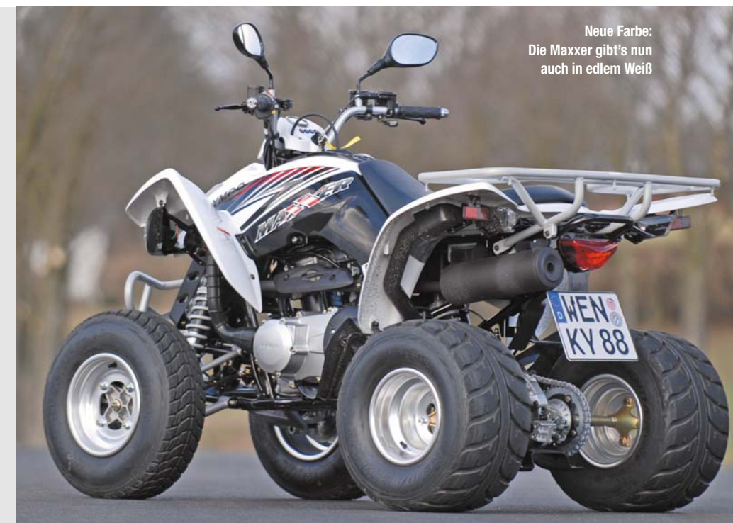
Neue Farbe: Die Maxxer gibt's nun auch in edlem Weiß

Der Preis ist heiß. Für unter 4.000 Euro erhält man beim Kymco-Händler mit der 250er Maxxer ein ausgereiftes Quad, das ohne weiteres mit hubraumstärkeren Fahrzeugen konkurrieren kann. Die Ausstattung ist top: serienmäßig verbaut Kymco an der Maxxer Aluräder und montiert am Rahmenheck eine große Gepäckbrücke. vdm