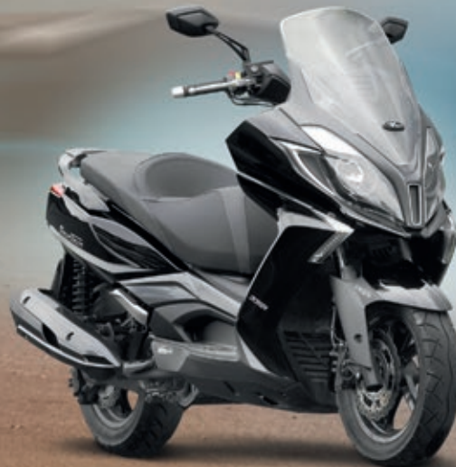
NEW DOWNTOWN 350i ABS v černé