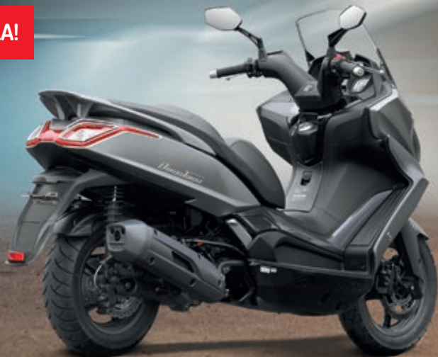
NEW DOWNTOWN 125i ABS ve stříbrné